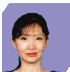
Lin Dan DCM