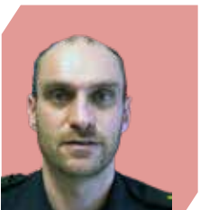
Philippe Duparc Security