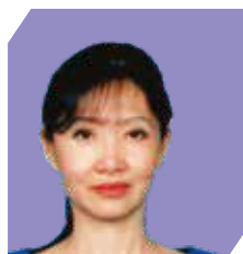
Lin Dan DCM