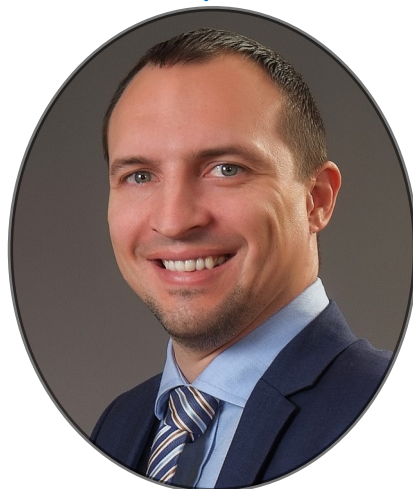
SEKE Atila OHCHR