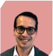
Jamshid Gaziye OHCHR